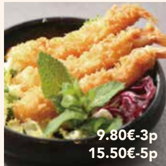
9 TEMPURA CREVETTE 9.80€-3p / 15.50€-5p