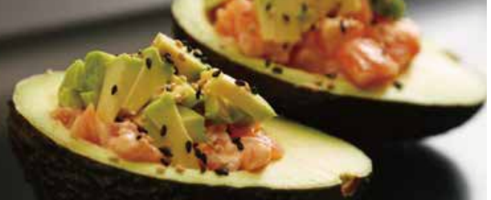
E3 AVOCAT TARTARE 14.00€ Avocat, saumon, sauce ponzu, 2 pièces