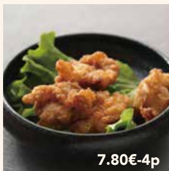
18 POULET FRIT 7.80€-4p