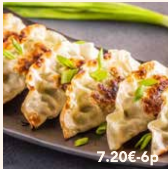
8 GYOZA 7.20€-6p Poulet ou végétarien