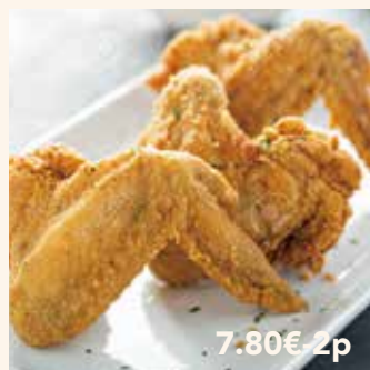
19 WINGS 7.80€-2p