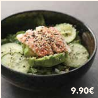
1 SALADE SAKURA 9.90€ Salade, crevettes, avocat, concombre et sésames