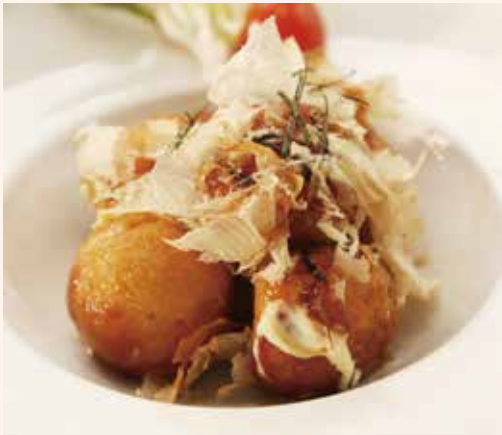
E1 TAKOYAKI 12.00€ Boulettes de poulpes avec katsuobushi (bonite séchée), mayonnaise japonaise & sauce anguille, 5 pièces