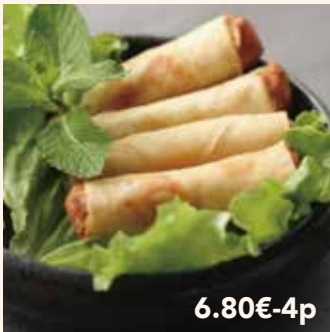
4 NÊMS POULET / CREVETTE 6.80€-4p