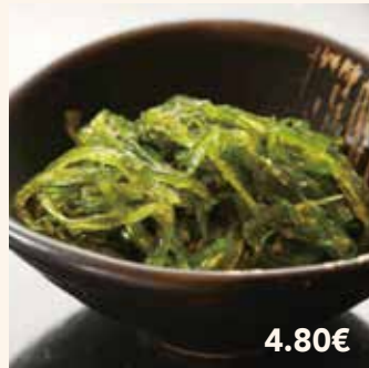
3 SALADE D'ALGUES 4.80€