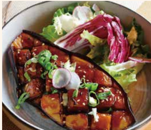
E2 NASU NO MISO YAKI 9.00€ Demi aubergine bio grillé au miso doux