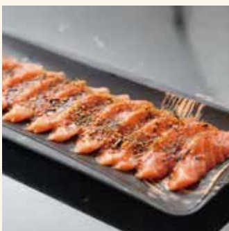
17 CARPACCIO 6 carpaccio saumon - 8.80€ 6 carpaccio thon - 9.80€ 6 carpaccio daurade - 8.80€