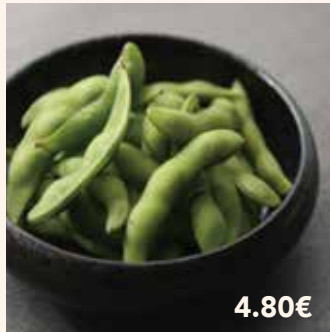
2 EDAMAME 4.80€